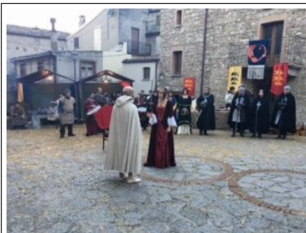
Il Medioevo e Gioacchino – passata edizione

SAN GIOVANNI IN FIORE , martedì 26 marzo 2019.